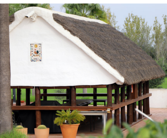
Barraca del riu petita, Amposta. Josep Juan, 2022