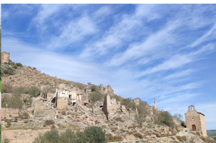
Rubió de Baix (Noguera). Ernest Cabré, 2023